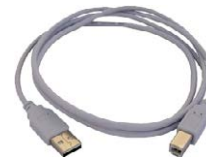
Cable de transmi- sión, terminado con conector USB