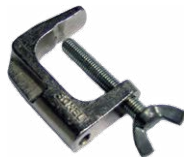
Mordaza (conec- tor tipo banana)