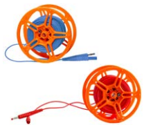
Cable 25 m para medir la toma de tierra en carrete (conectores tipo banana) azul / rojo