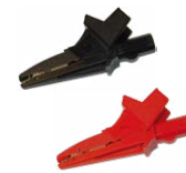
Cocodrilo 1 kV 20 A negro / rojo