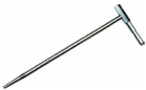
4x sonda de medi- ción para clavar en el suelo (30 cm)